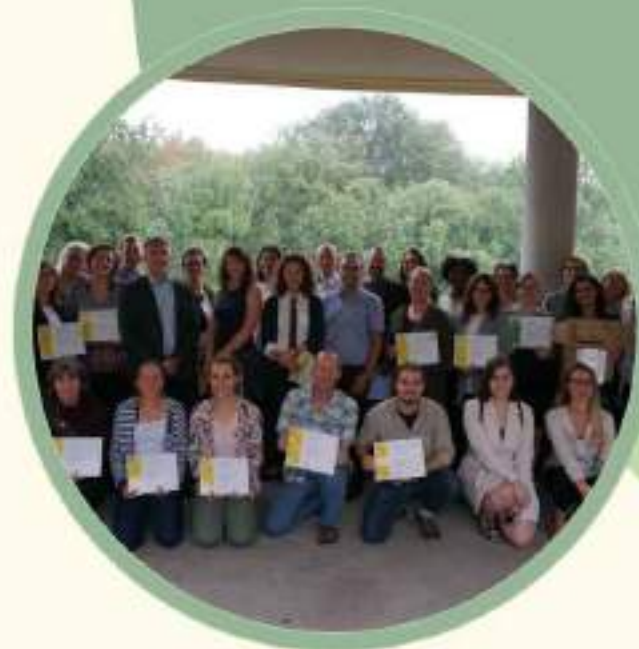
CÉGEP VERT DU QUÉBEC