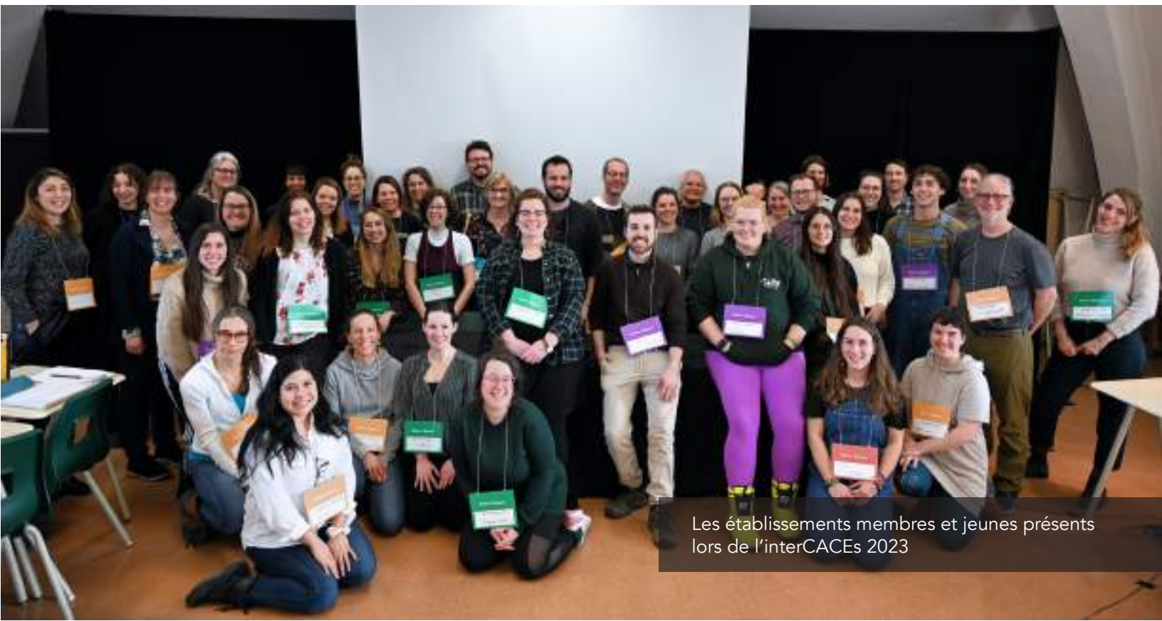
Les établissements membres et jeunes présents lors de l'interCACES 2023