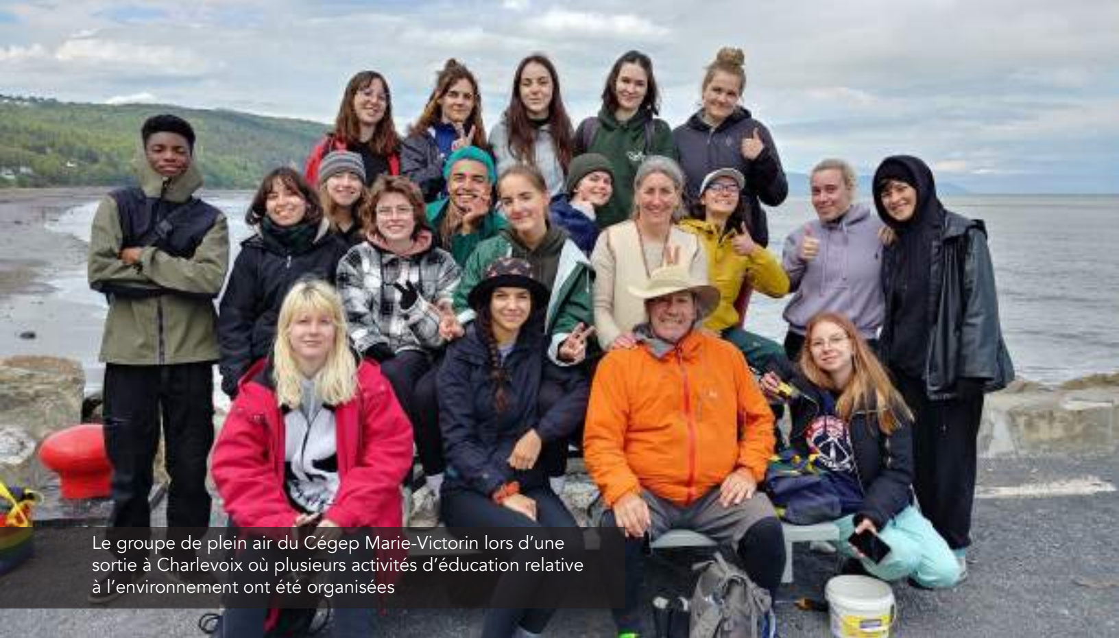
Le groupe de plein air du Cégep Marie-Victorin lors d'une sortie à Charlevoix où plusieurs activités d'éducation relative à l'environnement ont été organisées

participantes de mieux comprendre ce qu'est l'ÉRE, ses principes fondamentaux et ses bienfaits, d'explorer différentes formes que peut prendre l'ÉRE dans le contexte scolaire et de découvrir quelques moyens qui facilitent son intégration à l'école.