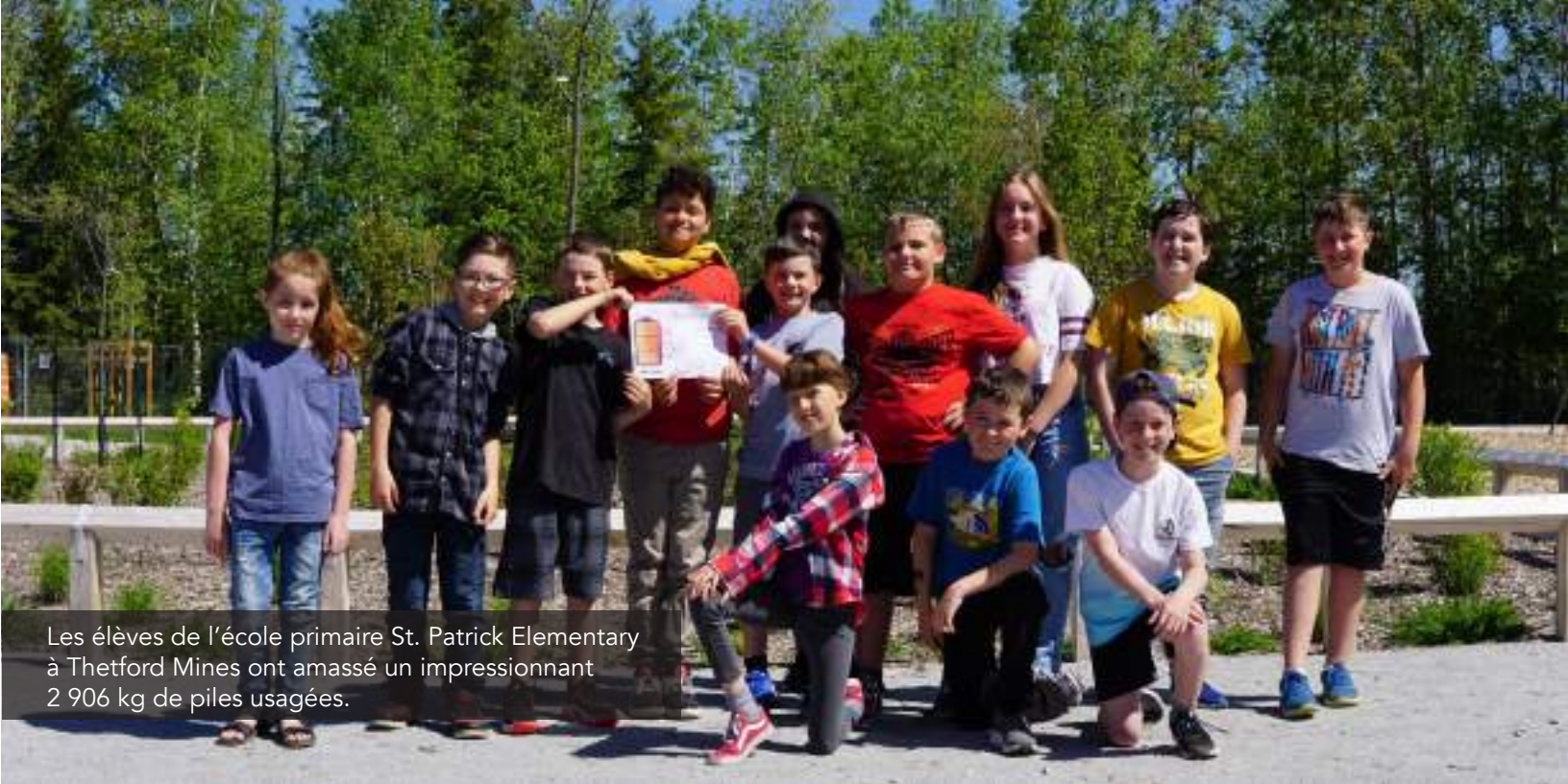
Les élèves de l'école primaire St. Patrick Elementary à Thetford Mines ont amassé un impressionnant 2 906 kg de piles usagées.

L'école primaire Sainte-Luce, au Bas-Saint-Laurent, est la championne de la mobilisation. Chacune et chacun des 43 élèves a amassé en moyenne 34 kg de piles, pour un total de 1 463 kg. Au collégial, c'est le Cégep de Granby qui est arrivé en tête avec 217 kg.