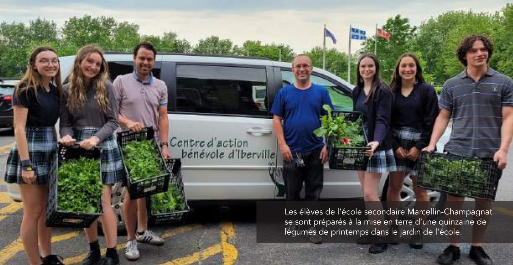
Les élèves de l'école secondaire Marcellin-Champagnat se sont préparés à la mise en terre d'une quinzaine de légumes de printemps dans le jardin de l'école.

Plus de 210 projets environnementaux portant sur des thématiques variées ont été menés au sein des établissements membres. Afin de promouvoir les principes d'économie circulaire et de tisser des liens entre les familles, le CPE Lieu des Petits a mis sur pied un bazar d'entraide proposant des vêtements et des accessoires pour les enfants. Les parents et personnes employées pouvaient échanger, prendre ou donner des vêtements et accessoires ; les articles restant ont été remis à des organismes communautaires du quartier.